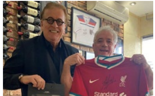
LIVERPOOL: Geson har blant annet fått en Liverpool-drakt, signert av legenden Kevin Keegan.

Målet med draktauksjonen er å sikre NFTs TRENERFOND en egenkapital på 150 000 kroner, slik at fondet kan være operativt fra og med 2023.